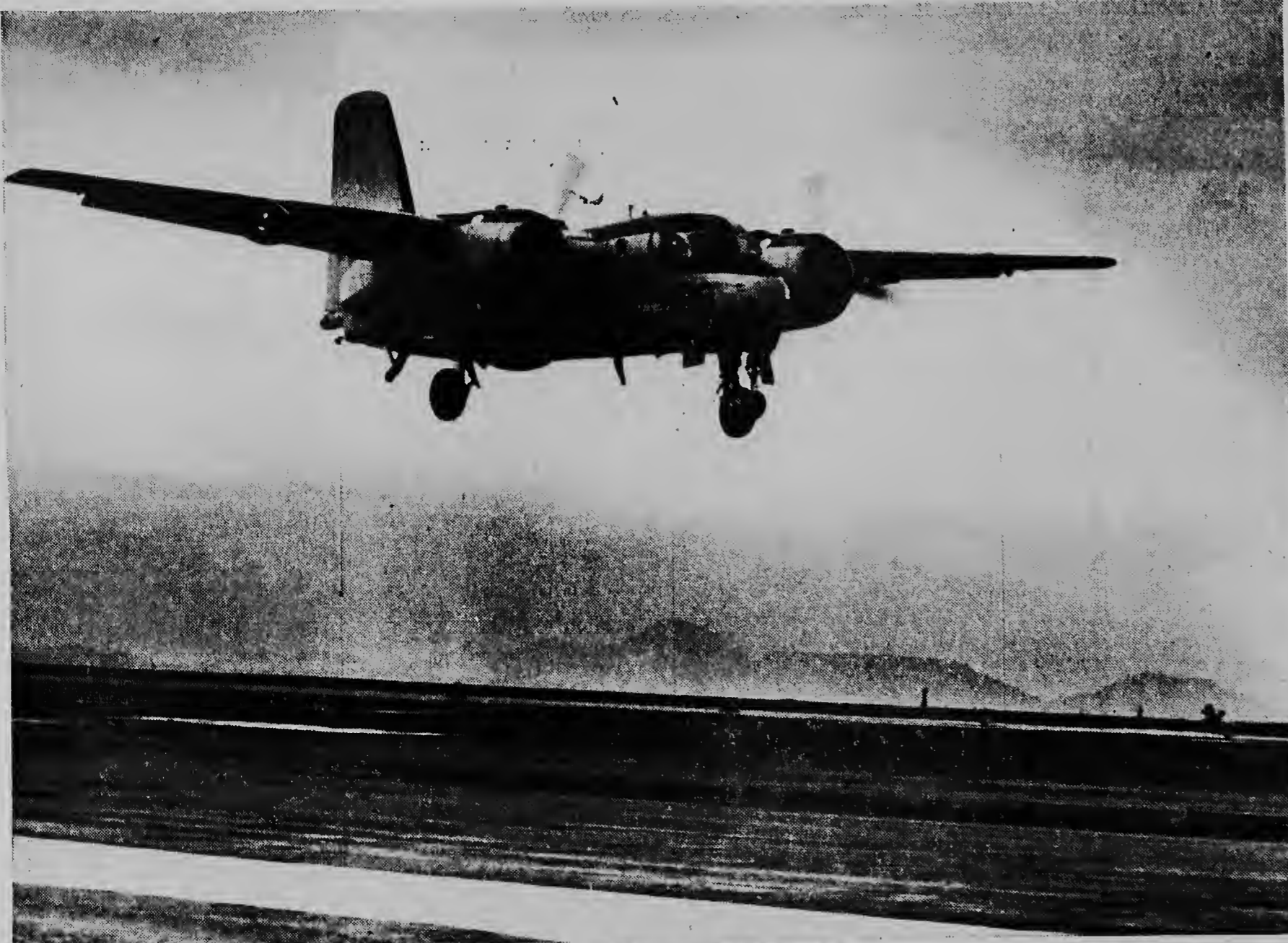
E ganancia di mas nobo di Servicio Aerea di Marina MLD. Su "Tracker" S.2 F. aterrizando riba startbaan di dr Albert Plesman Luchthaven na Corsow. MLD ta tumu su tarea di vigilancia di nos islanan seriamente na pecho. Nan ta vigila tanto territorionan insular como tambe territorionan di laman na Antillas Neerlandes.